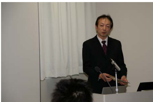
入試説明（大学院医薬保健学総合科学研究科）