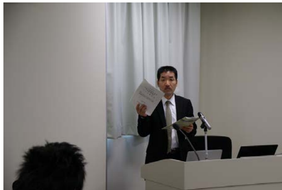
入試説明（大学院自然科学研究科）