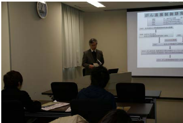
所長によるがん進展制御研究所の概要説明